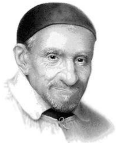
St Vincent de Paul (1581-1661)

V roku 1605 Vincent cestoval do Marseille. Na spiatocnej ceste loďou ho zajali tureckí piráti. Predali ho za otroka do Tunisu. Najprv pracoval